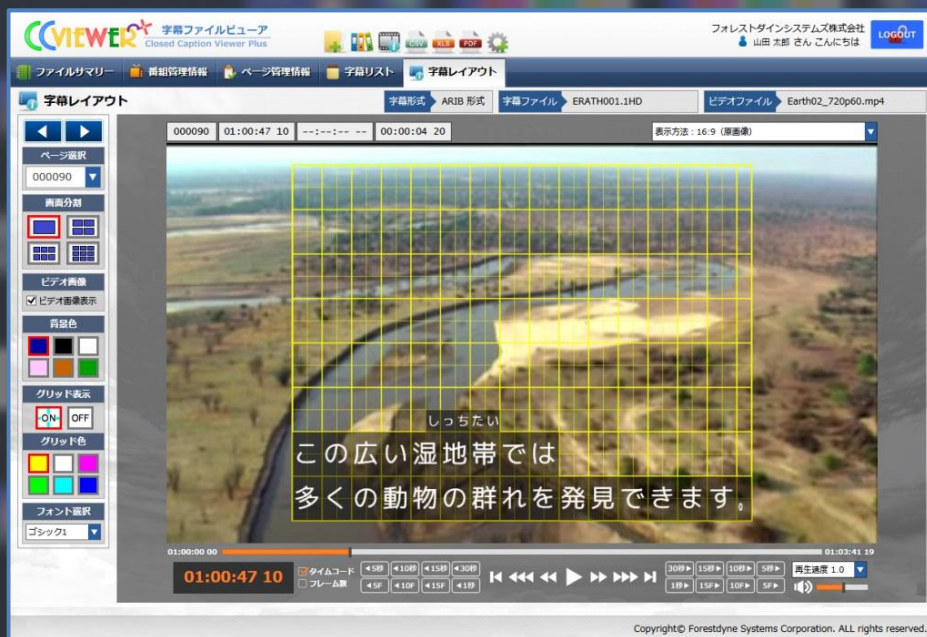
【 CCViewer Plus アプリケーション画面 - 字幕レイアウト表示サンプル 】