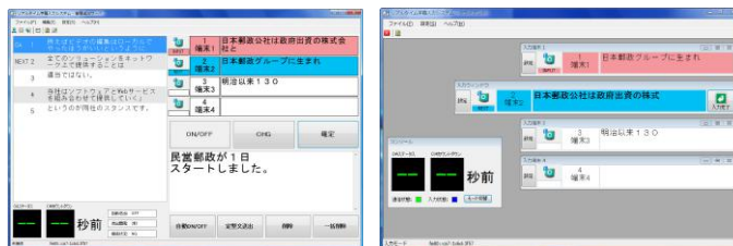
【管理送出端末画面】 字幕編集および字幕送出を行います。

ARTi-CSBは、最大6台までの字幕入力端末と、1台の管理送出端末により生放送へのリアルタイム字幕の制作を行うシステムです。また、入力されたテキスト情報はNeONに取り込むことも可能です。パッケージ字幕用の文字素材作成ツールとして、時間に限りのある字幕制作場面でご活用頂けます。